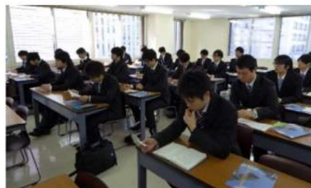
土木工学科業界セミナーの様子