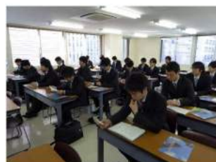
土木工学科業界セミナーの様子