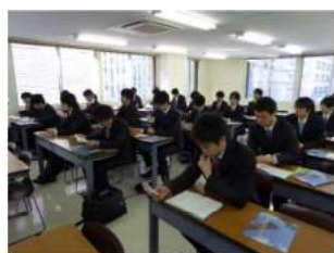
土木工学科業界セミナーの様子